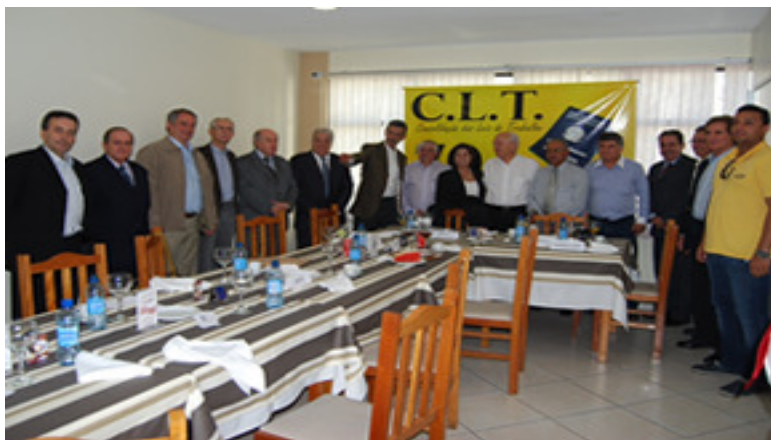
Ministro do Trabalho com integrantes do FST

Objetivando avançar nas conquistas e direitos, o Fórum Sindical dos Trabalhadores recebeu o Ministro do Trabalho e Emprego, Manoel Dias, em Florianópolis (SC). A audiência foi realizada no Restaurante Lindacap, sendo prestigiada pelos dirigentes sindicais das maiores confederações do País.